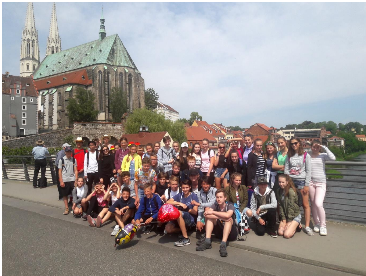
Exkurze v Německu

V rámci vyučování vybírají pedagogové školy ve spolupráci s Městským divadlem v Jablonci nad Nisou divadelní představení pro žáky. Cílem návštěv divadelních představení je nejen vzdělávat žáky, ale také alespoň jednou za poletí umožnit návštěvu prostředí divadla.