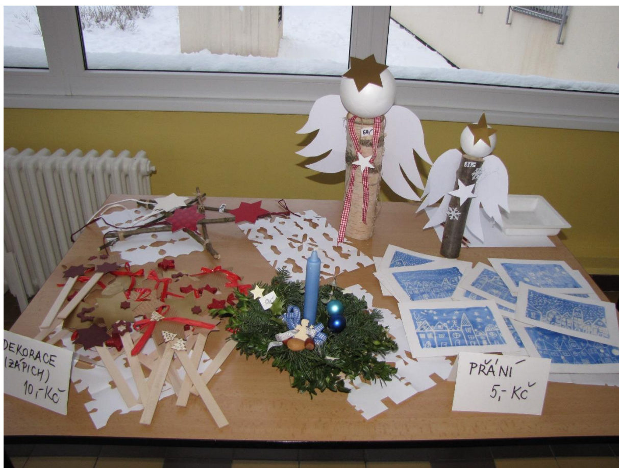
Vánoční trhy a dílny

Dalších 6 žáků ve školním roce 2017/2018 plní povinnou školní docházku podle §38 Školského zákona.