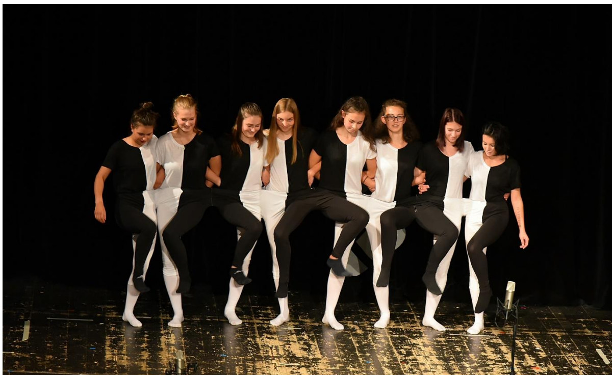
Akademie 9. tříd

Školní rok byl zakončen Akademií – loučením s devátými třídami v sále Eurocentra.