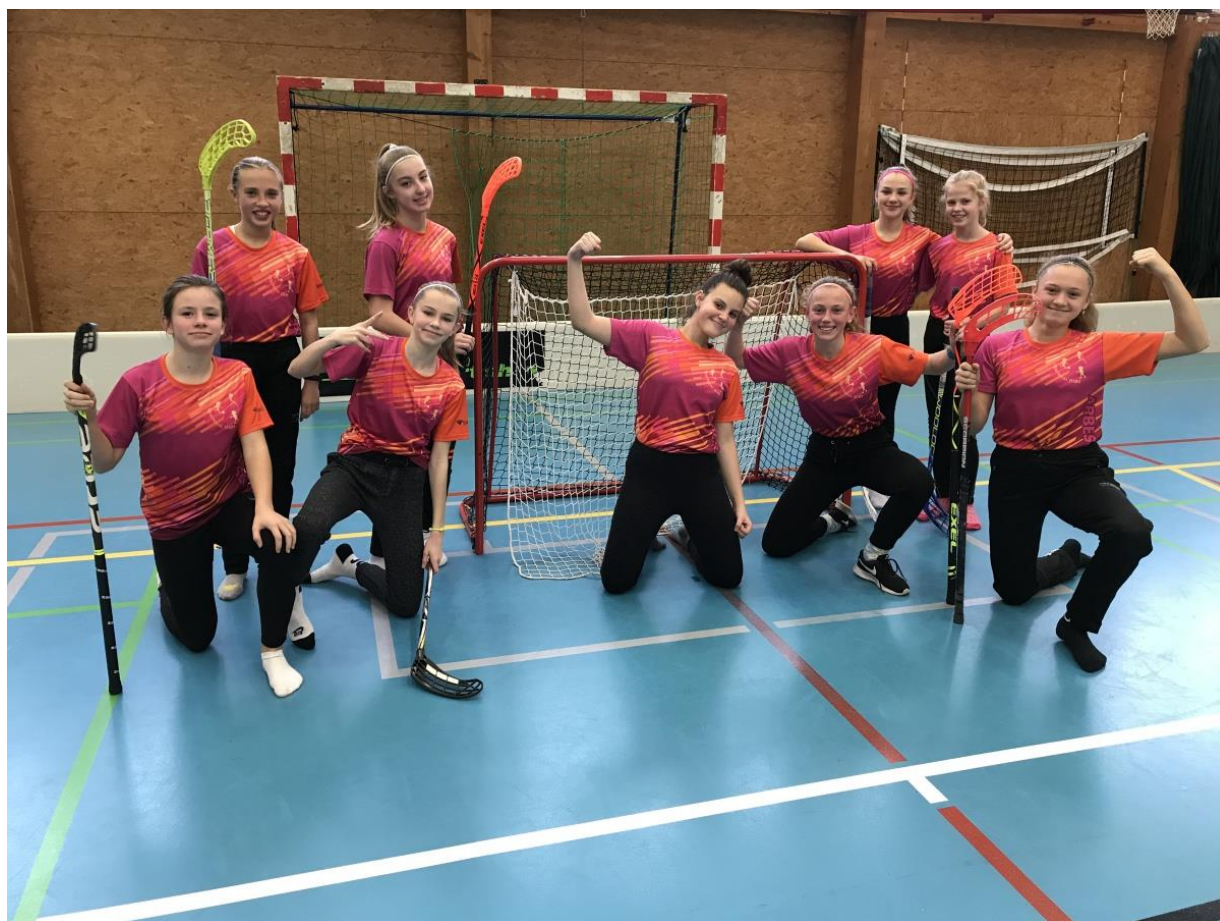
Z florbalového turnaje

Posuzováno podle zákona č. 563/2004 o pedagogických pracovnících a změně některých zákonů.