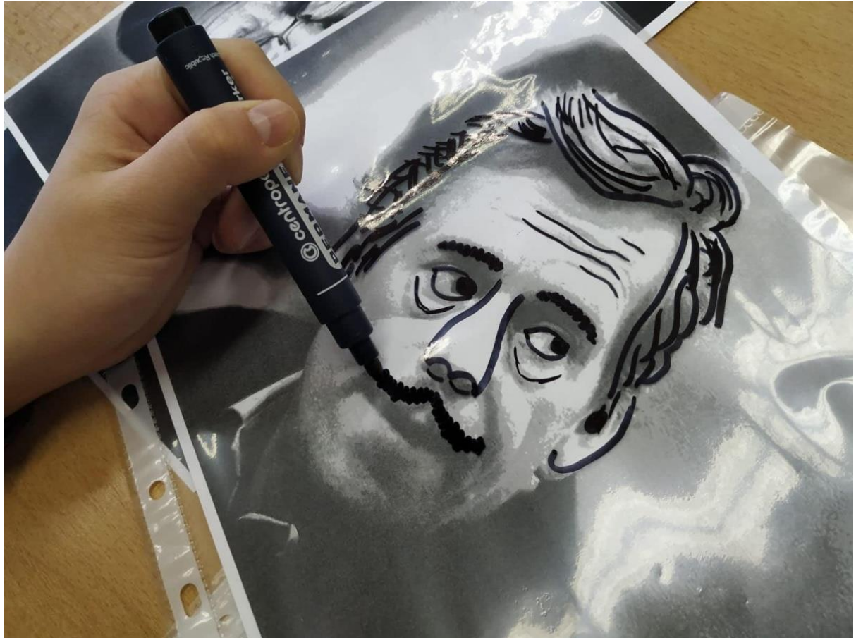
Projektový den 30 let svobody