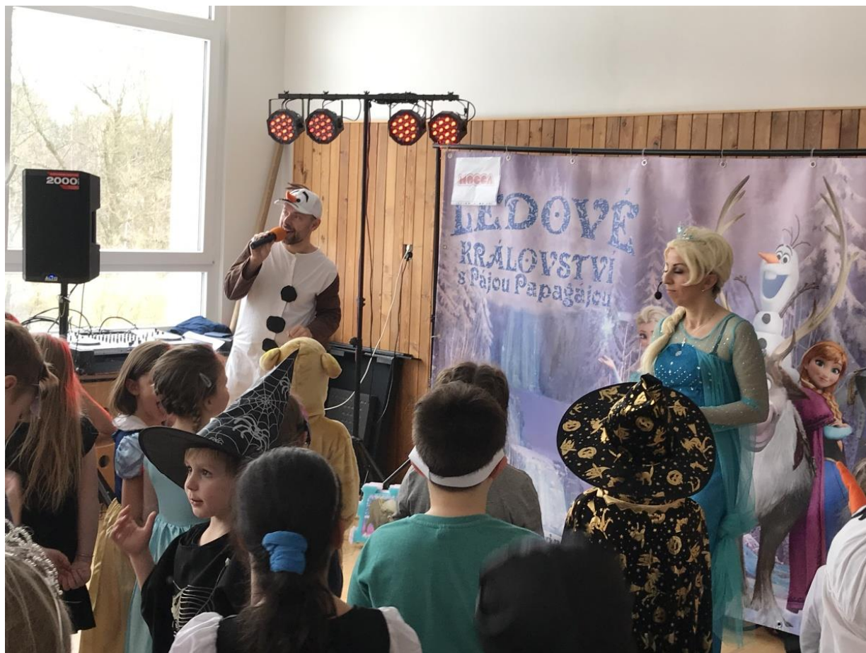
Halloween ve školní družině