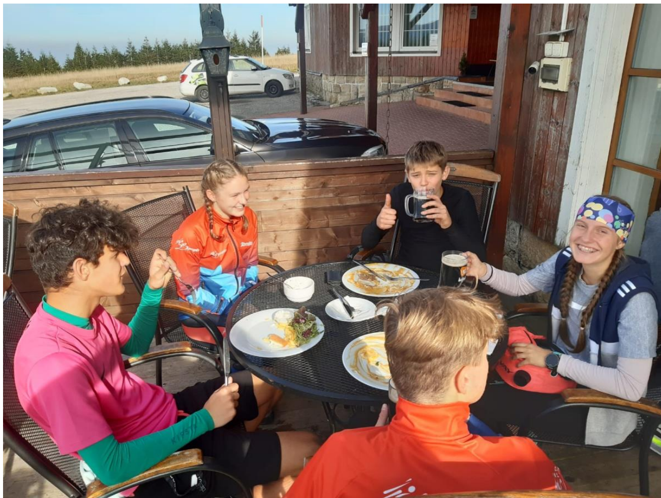
Z přechodu Krkonoš