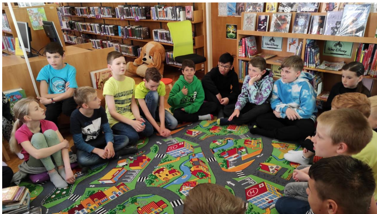
Program v Městské knihovně

Výchovná poradkyně vedla dokumentaci, která obsahuje odborné zprávy o žácích v poradenské péči, databázi žáků s vývojovými poruchami učení a integrovaných žáků, které pravidelně aktualizovala. Podle požadavků vycházejících z výuky byly odesílány k vyšetření školní dotazníky o žácích. Na základě doporučení PPP nebo SPC byly pro žáky se speciálními vzdělávacími potřebami vypracovány IVP. S plány byli následně seznámeni všichni pedagogové, včetně asistentů pedagoga. Výchovná poradkyně kontrolovala vypracování a plnění těchto individuálních vzdělávacích plánů včetně jejich hodnocení. Probíhala setkání rodičů žáků se speciálními vzdělávacími potřebami a rodičů i žáků s asistencí s přítomností AP, která byla zaměřena