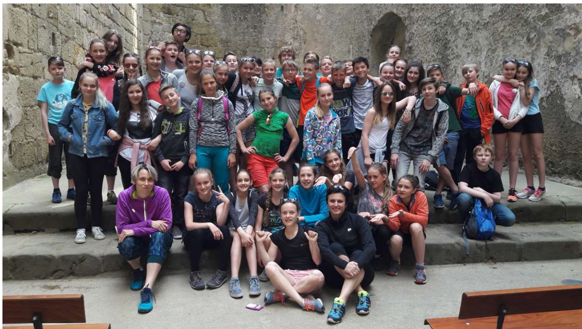
Z Exkurze do Německa

Školní rok byl zakončen Akademií – loučením s devátými třídami v sále Eurocentra.